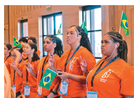
↑巴西如来之子青年团33人参加南美洲佛光青年联谊会。

圭青年团团团长严罕德等。透过一系列讲座、课程、论坛及创意活动，深入探讨「共生与共荣」的核心精神，并结合实践人间佛教理念，促进跨国文化交流，增进青年友谊，提升自我。